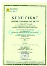
Sertifikat Pengawasan Mutu